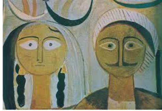
شكل رقم (١)