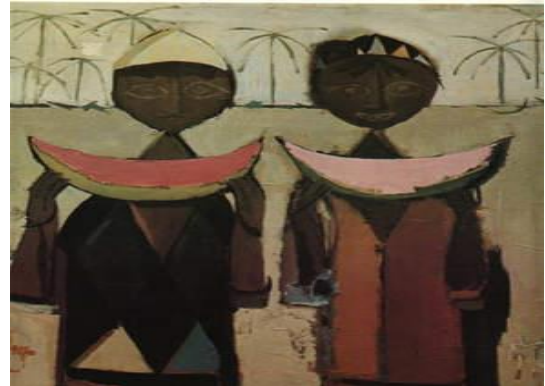
شكل رقم (٣)