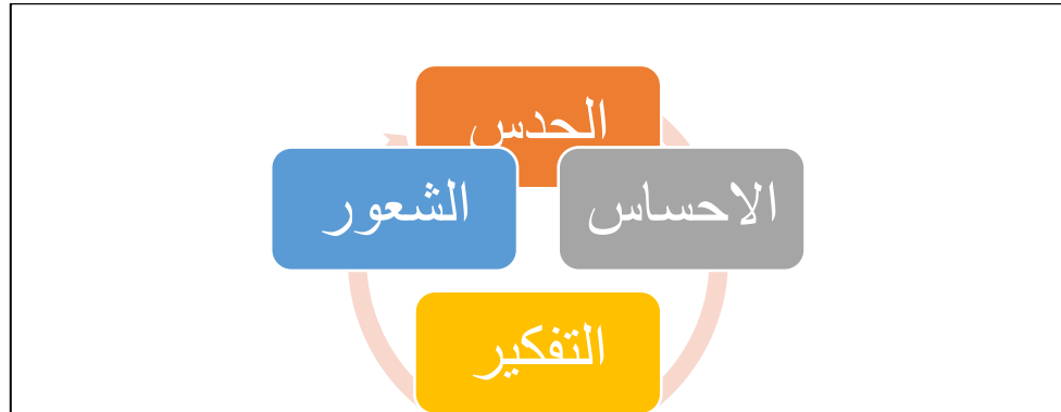
شكل رقم (1) يوضح خطوات