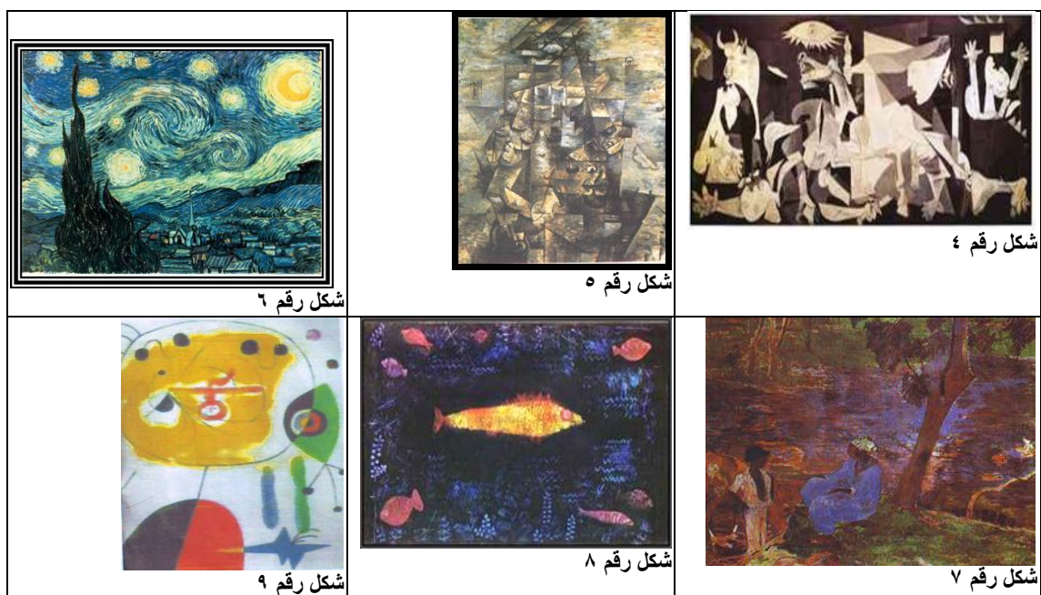
ملحق رقم (٢) مجتمع البحث