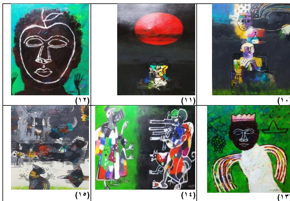
ملحق رقم (٣) فهرست الاشكال