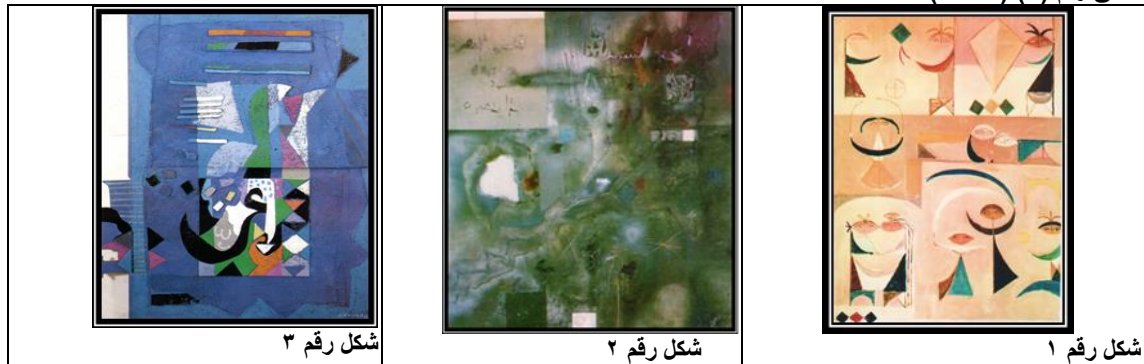
شكل رقم ٣